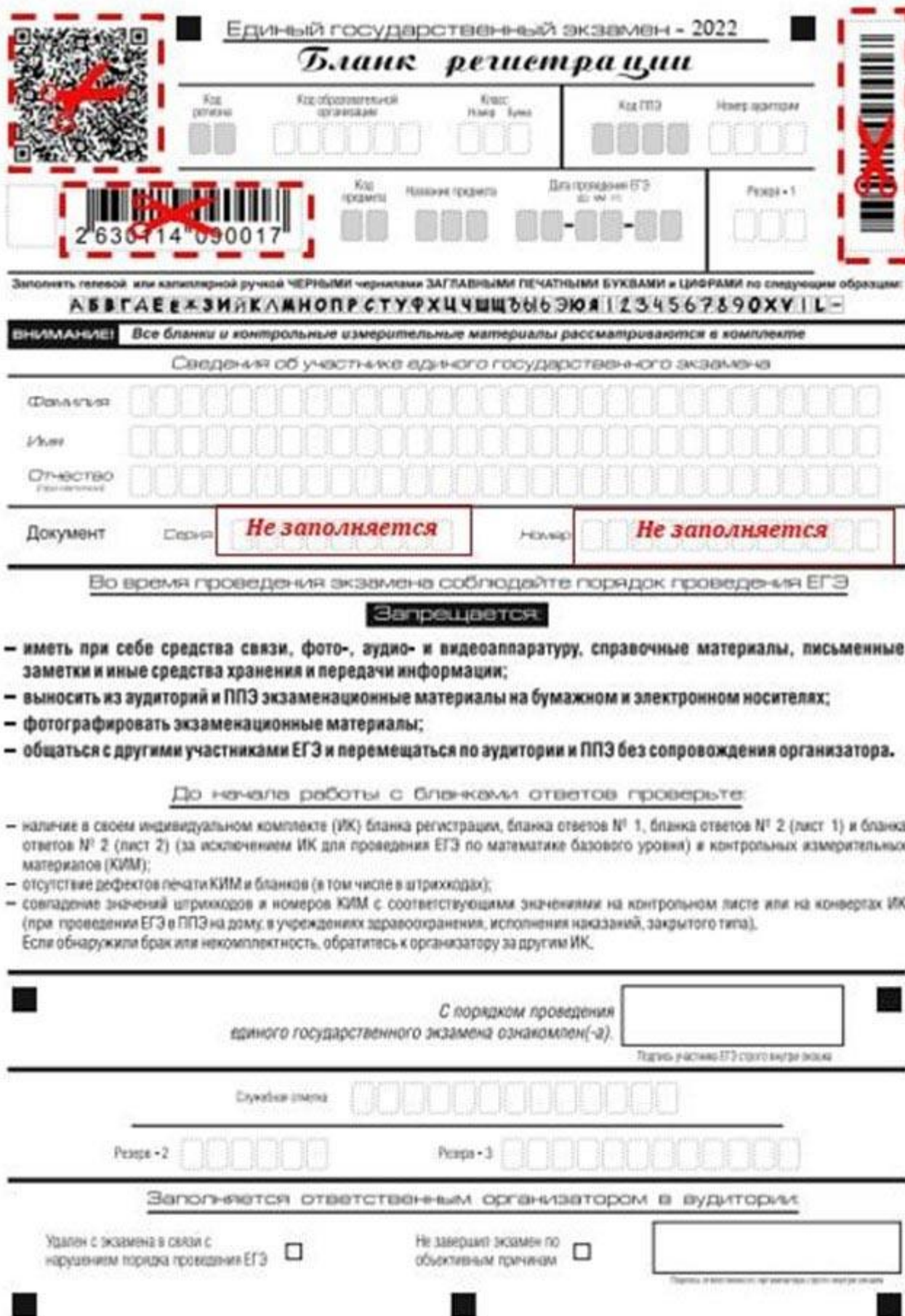
Рис.1. Исключение штрих-кода с бланка регистрации